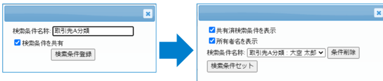
図 2-1 共有した検索条件の登録(左)と、共有された検索条件の読込(右)

また、検索条件の作成者名も表示可能なため、複数名による同じような名前の検索条件が増えた場合にも、作成者を一目で確認できます。